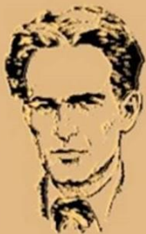
ВТОРО СУ Н.Й.ВАПЦАРОВ МОНТАНА